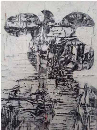
Anonyme 22 Technique mixte / toile - Date : 2024 Dimensions : 45X60 cm

Après une formation à la Villa Thiole (École municipale d'Arts Plastiques de la ville de Nice) et aux Beaux-arts de Toulon, Richard a cherché à initier sa propre démarche artistique en explorant supports et matériaux (plâtre, ciment, objets de récupération, peinture sur bois et toiles...) pour finir par détourner les matériaux industriels mis au rebut en réinventant une lecture singulière de ces supports. L'artiste développe aujourd'hui plusieurs écritures : un travail en 3 dimensions (créatures hybrides et fantastiques) évoquant les tourments de la condition humaine, une exploration de l'expression plastique de l'argile et des œuvres sur toile.