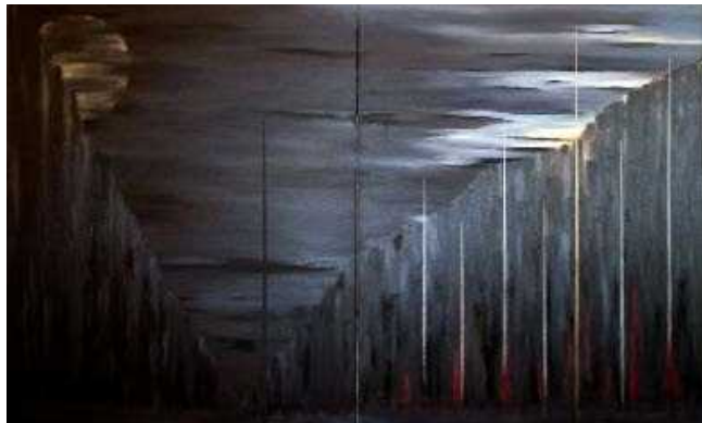
Orphée et Eurydice Huile sur toile - Date : 2006 - Diptyque 160X100 cm (partie d'un quadriptyque de 160x140 cm)