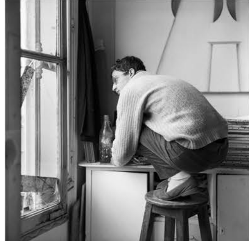
André Marzuk 1969

Penser en images. Cette phrase évoque le processus créatif d'André Marzuk, artiste inclassable, qui semble à la recherche d'un absolu dans l'art : il matérialise ses idées en formes tantôt réalistes, tantôt abstraites, embarquant le spectateur dans un bout d'histoire, son histoire mais aussi celle du monde qui l'entoure. Un monde peuplé d'images, assailli même par des flots de visuels. L'artiste sélectionne et modifie, altère, tord les images avec une facilité déconcertante, transcendant les techniques, pour mieux nous les donner à voir, et à penser. Il recompose ainsi notre réel et propose une balade éclectique où le processus créatif est passionnant. André Marzuk est un tisseur d'images et un passeur de réflexion.