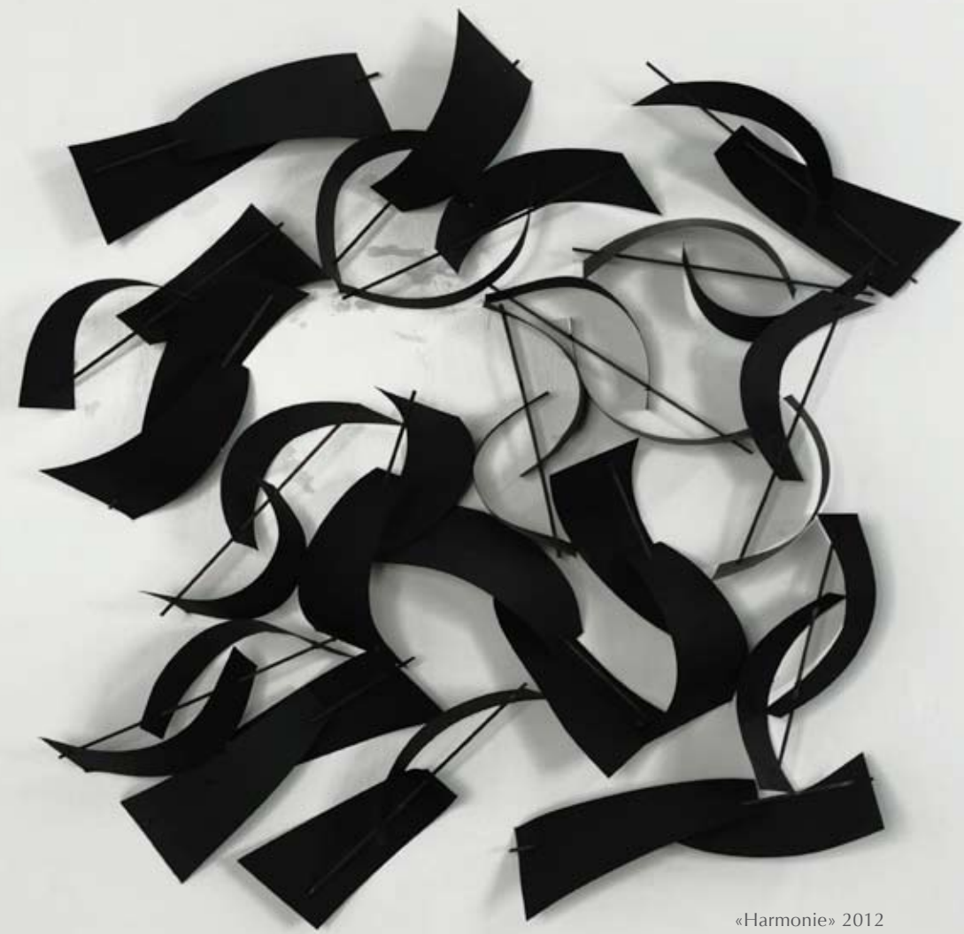
«Harmonie» 2012 Papier Canson et osier, 80 x 80 cm.