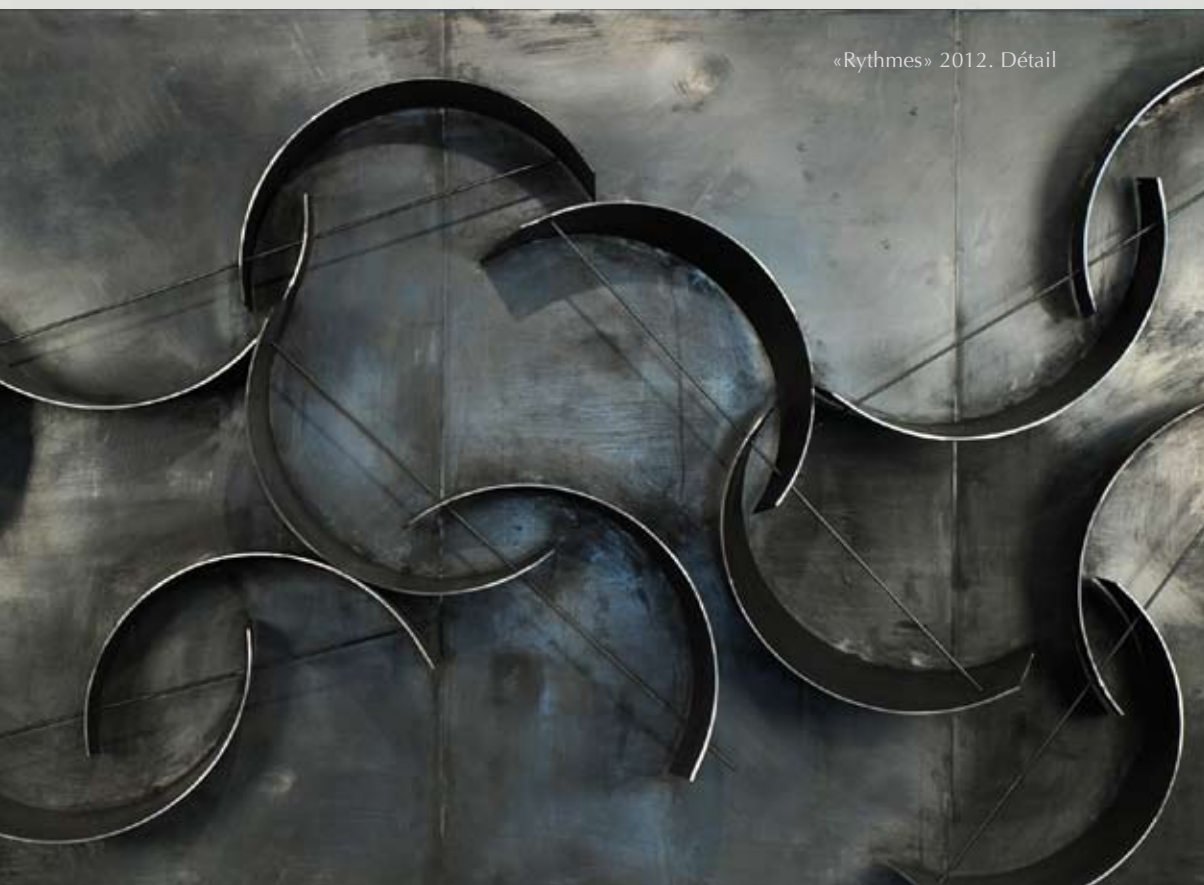
«Rythmes» 2012. Détail