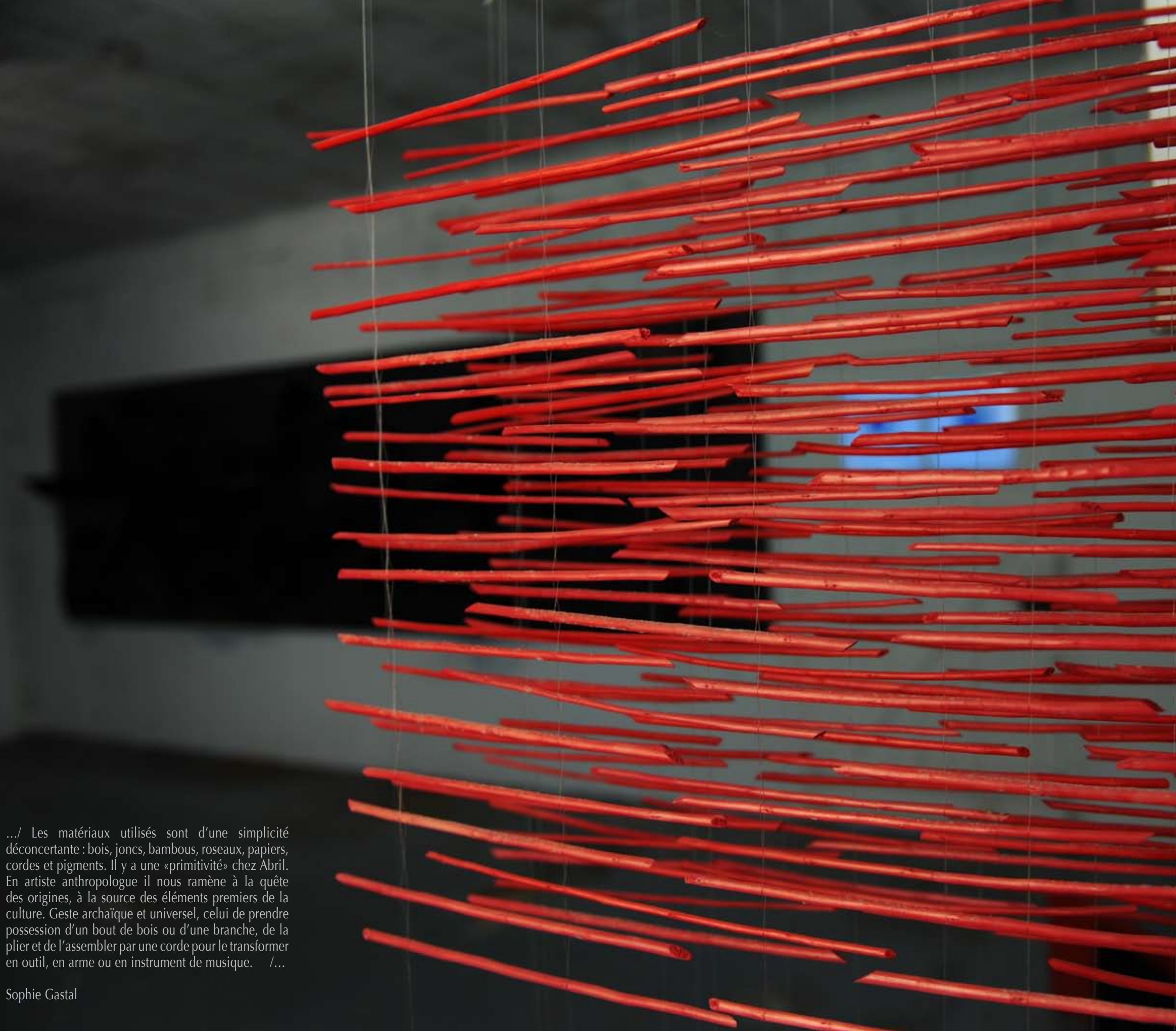
Dans l'atelier de Vallauris, 2012