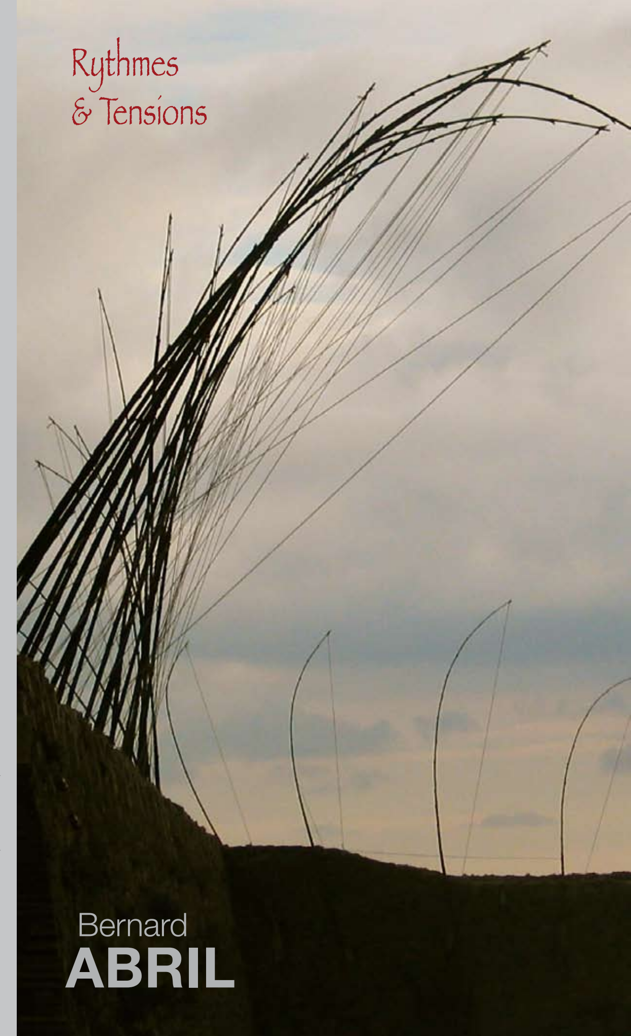
«Tensions», Saint Paul de Vence, 2008 - Photo Frédéric Carré.