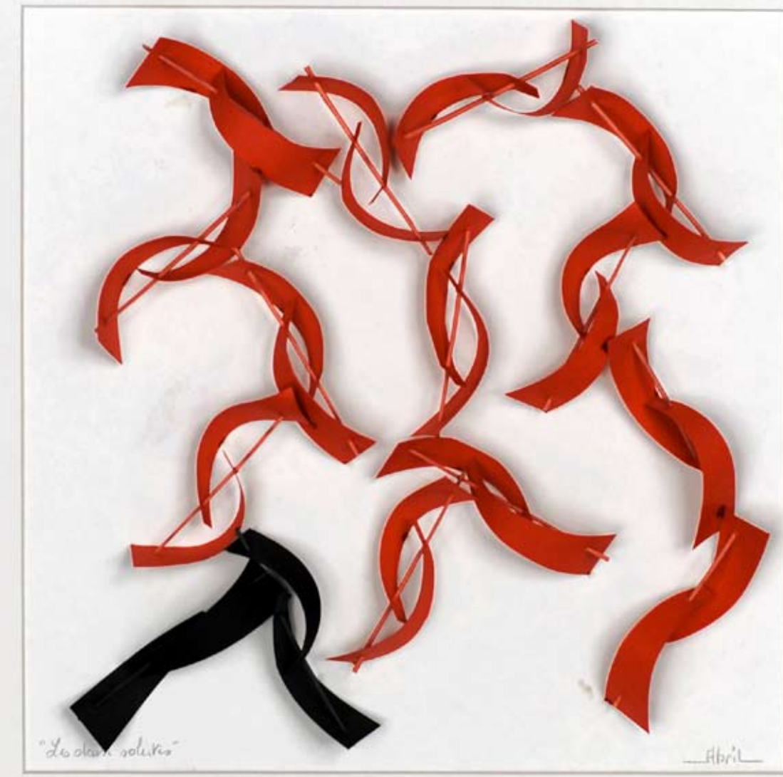
«Les deux solistes» 2012 Papier Canson et osier, 50 x 50 cm.