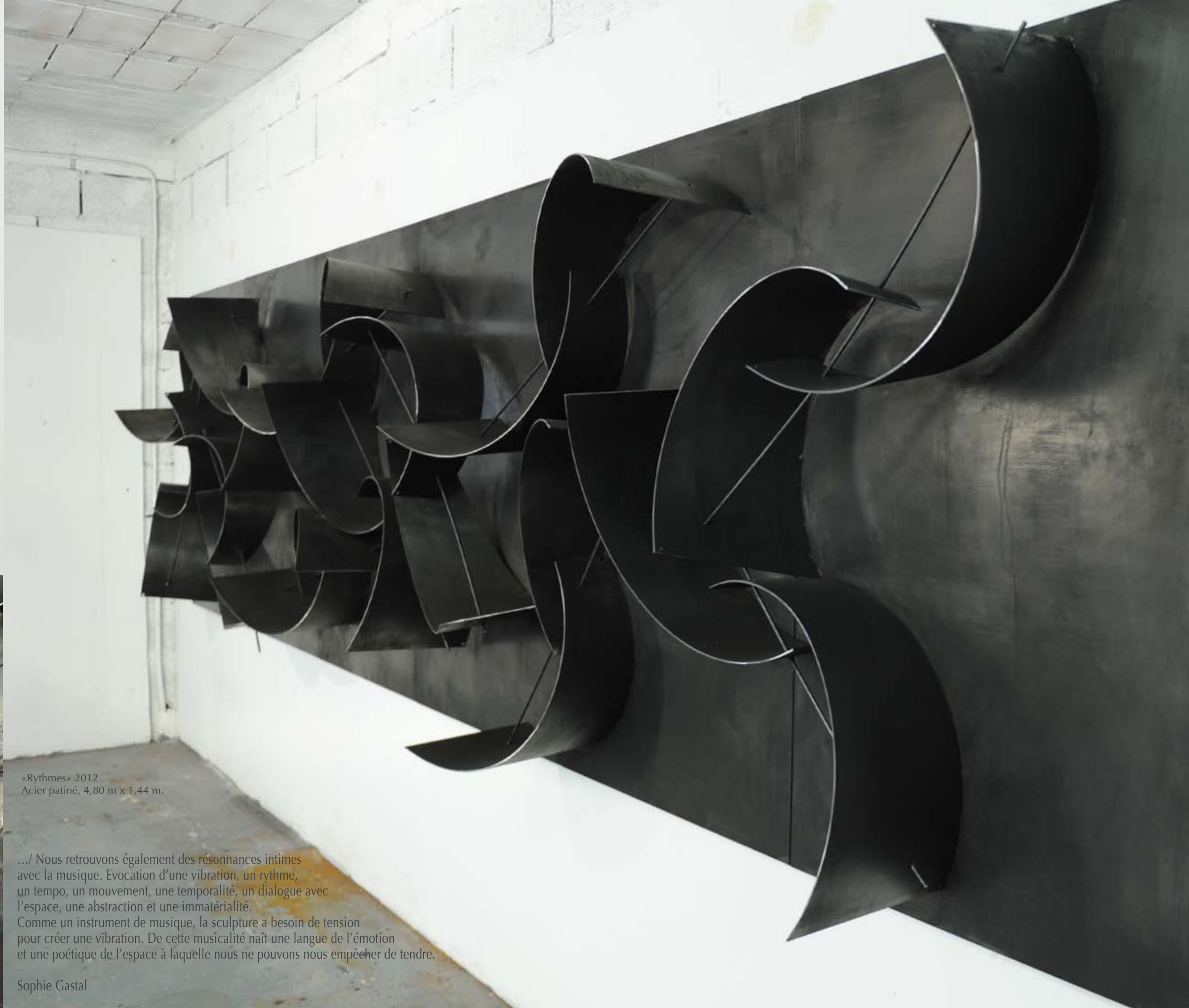
«Rythmes» 2012 Acier patiné, 4,80 m x 1,44 m.

.../ Nous retrouvons également des résonances intimes avec la musique. Evocation d'une vibration, un rythme, un tempo, un mouvement, une temporalité, un dialogue avec l'espace, une abstraction et une immatérialité. Comme un instrument de musique, la sculpture a besoin de tension pour créer une vibration. De cette musicalité naît une langue de l'émotion et une poésie de l'espace à laquelle nous ne pouvons nous empêcher de tendre.