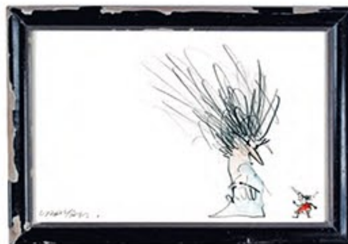
Editions stArt, Nice ISBN : 2-913222-53-6