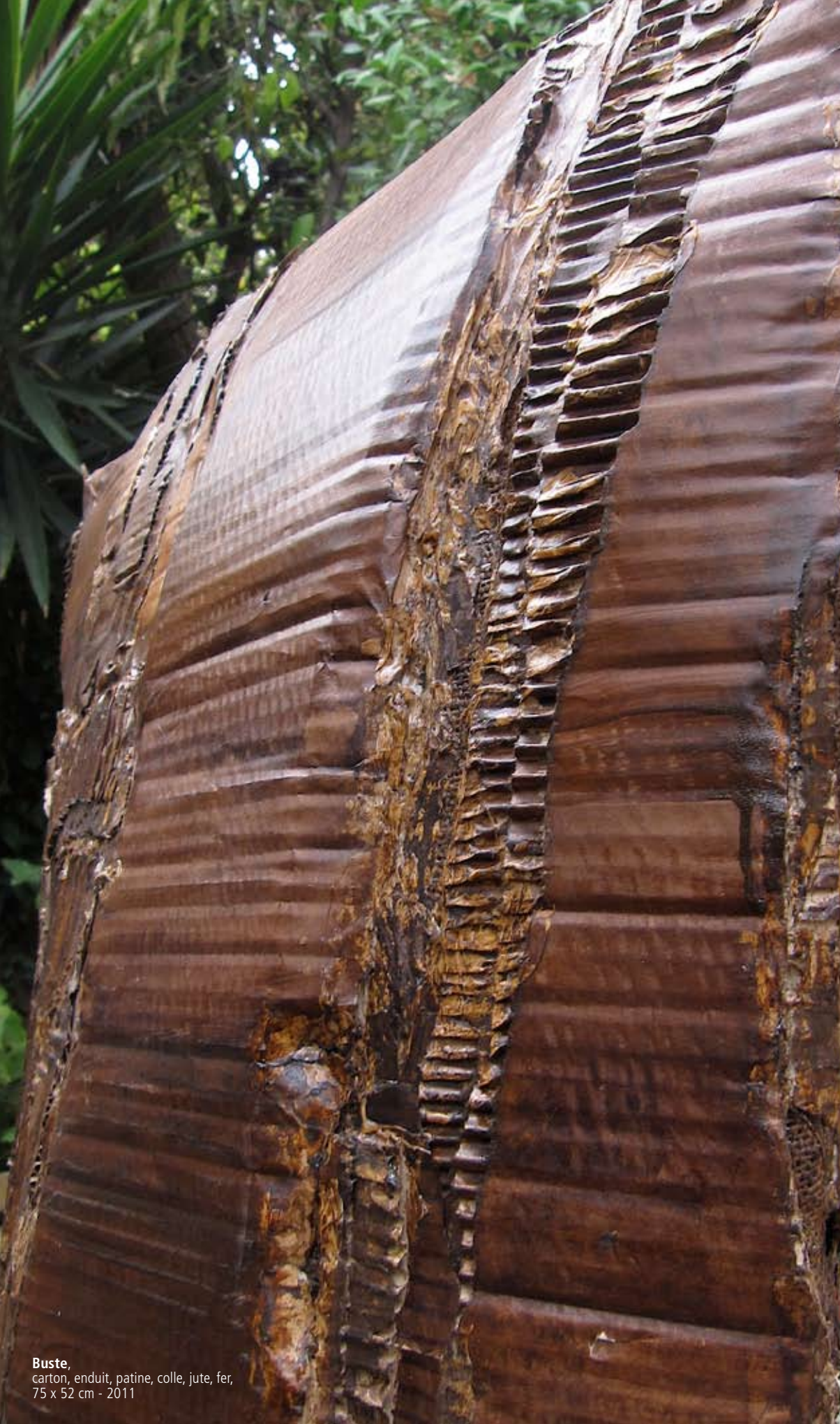
Buste , carton, enduit, patine, colle, jute, fer, 75 x 52 cm - 2011