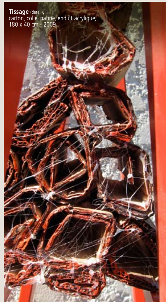
Tissage (détail) , carton, colle, patine, enduit acrylique, 180 x 40 cm - 2009