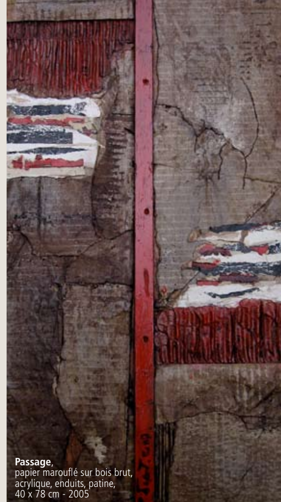
Passage , papier marouflé sur bois brut, acrylique, enduits, patine, 40 x 78 cm - 2005