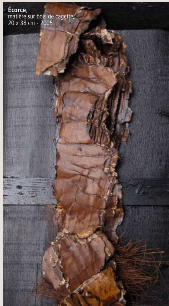
Écorce , matière sur bois de caquette, 20 x 38 cm - 2005