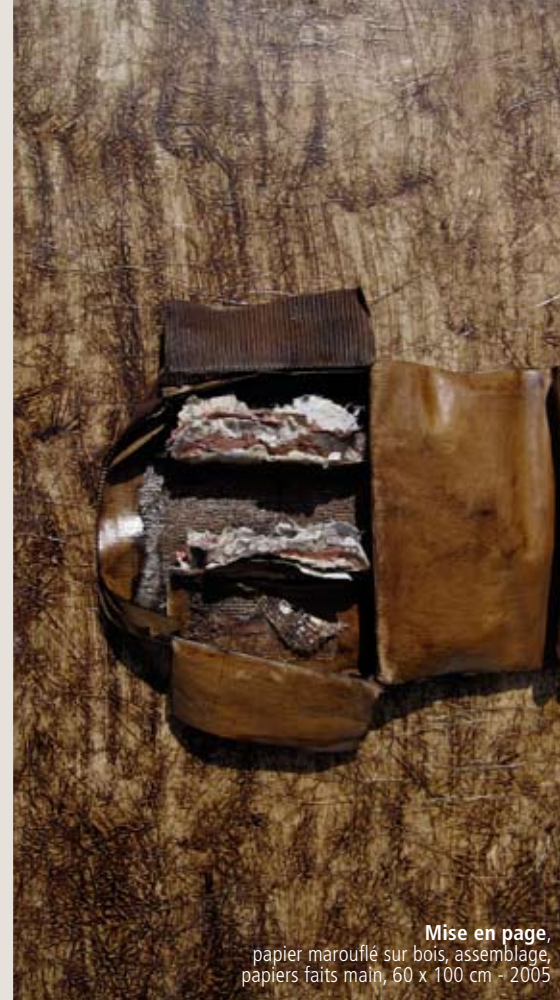
Mise en page , papier marouflé sur bois, assemblage, papiers faits main, 60 x 100 cm - 2005