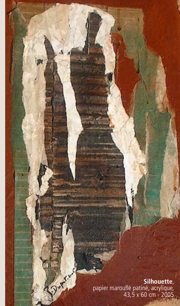
Silhouette , papier marouflé patiné, acrylique, 43,5 x 60 cm - 2005