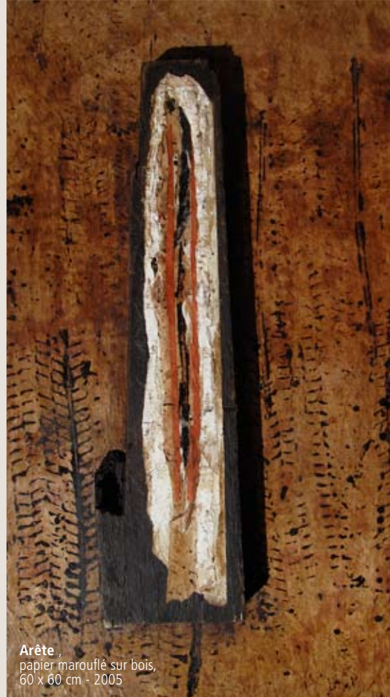
Arête , papier marouflé sur bois, 60 x 60 cm - 2005