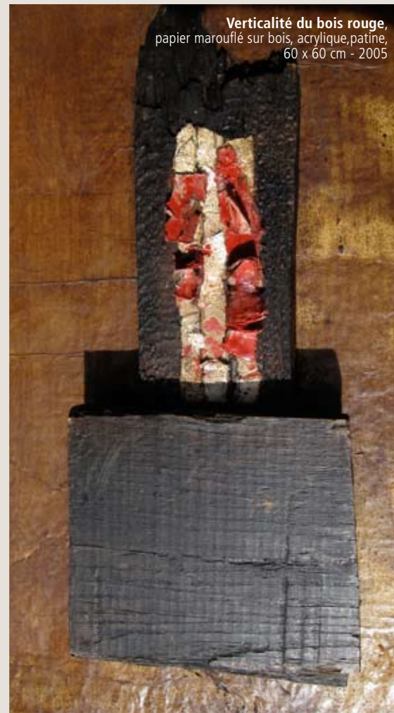
Verticalité du bois rouge , papier marouflé sur bois, acrylique, patine, 60 x 60 cm - 2005