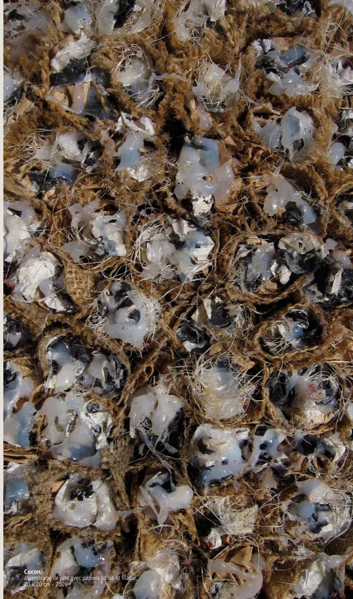
Cocon , assemblage de jute avec papiers collés et filasse, 20 x 20 cm - 2009