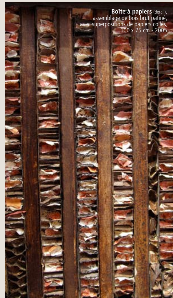
Boîte à papiers (détail) , assemblage de bois brut patiné, avec superpositions de papiers collés, 100 x 75 cm - 2005