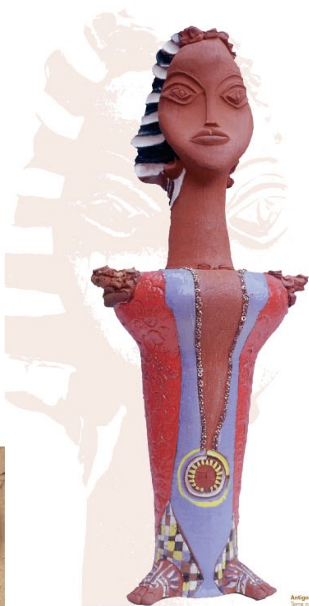
Antigone, 2002. H: 105 cm Terre cuite aux ergobes.