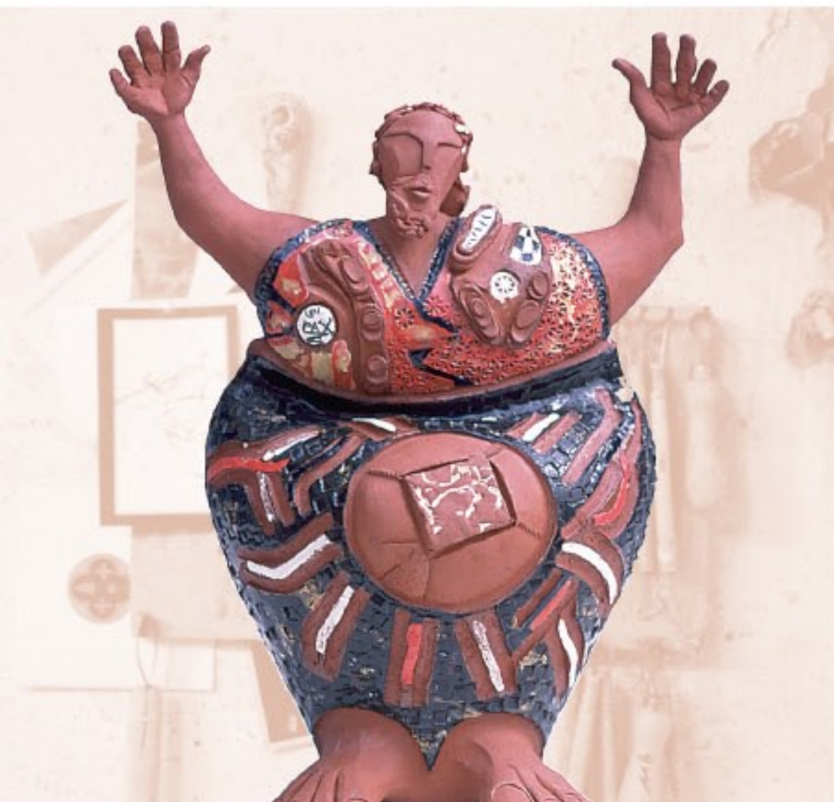
Jupiter. 2002. H: 80 cm Terre cuite aux engobes