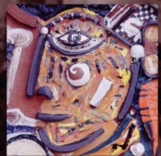
Le cahot et l'harmonie 2003. Plat 50 x 50 cm